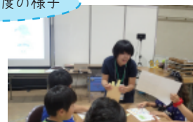
出前事業でサポート！