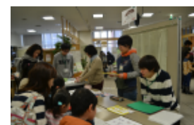
体験ブースの出展！