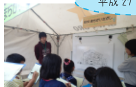
アクティビティの進行！