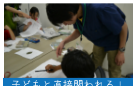
子どもと直接関われる！